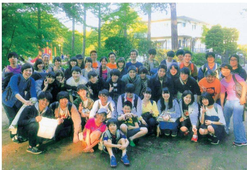
遊び場での集合写真